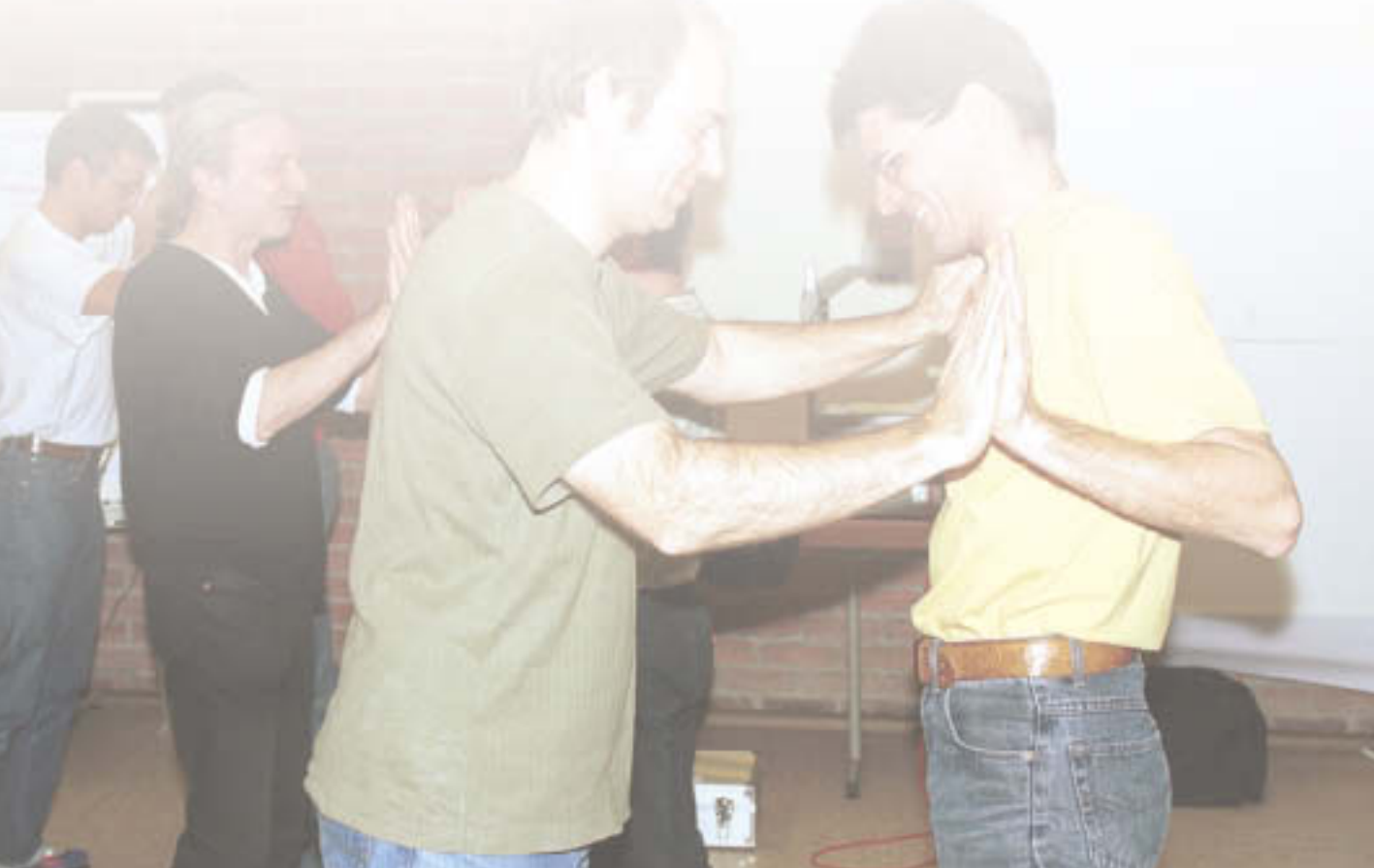
Offene Hände Das Spiel mit dem (Un-)Gleichgewicht

Auf den nächsten Seiten wird das Qualifizierungsmodul mit den didaktischen Schritten vorgestellt. Zu beachten ist, dass es sich um einen idealtypischen Ablaufplan handelt, der offen bleibt für Anregungen der Teilnehmer und es erlauben soll, auf „Störungen“ der Männer einzugehen; deshalb werden in allen Blöcken auch alternative Übungen und Methoden vorgestellt. Die hier angegebenen einzelnen Inhalte/Fragen, Methoden und Zeitvorgaben dienen nicht der Eingrenzung – sondern sollen helfen, ein genaueres Bild über den konkreten Ablauf und die Inhalte bei diesem ersten Fortbildungsmodul zu vermitteln.