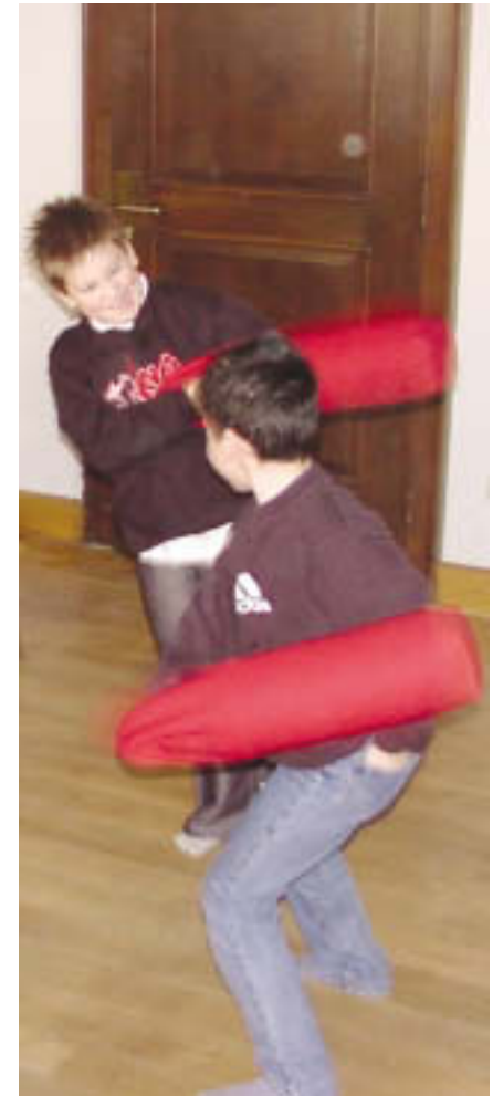
Aggressivität spielerisch erleben

Aus den Antworten geht hervor, dass fast alle Teilnehmer mit der Absicht in ihre Praxis zurückgehen, geschlechtsbezogene Angebote für Jungen zu entwickeln und anzubieten – und dass sie mehr Klarheit gewonnen haben, wie sie Interaktionsabläufe gestalten möchten.