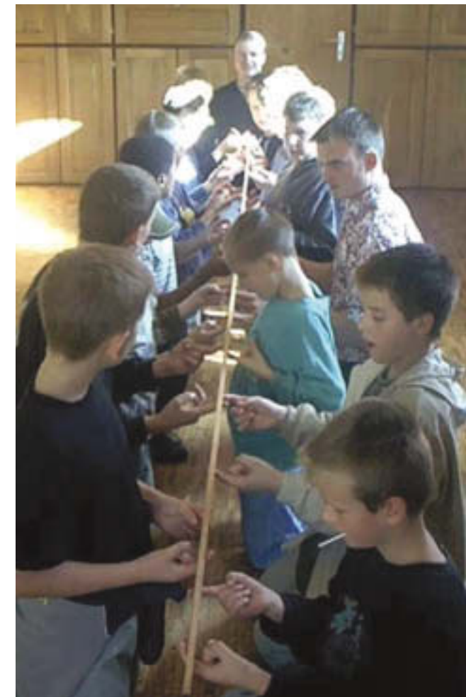
Team-Training Gemeinsam zum Erfolg

Die Erfahrungen werden in das abschließende Reflexionsmodul eingebracht. Die Sicherung der Erfahrungen muss geklärt sein, um den Fortbildnern/Fortbildungsträgern Rückmeldungen über Wirksamkeit und Erfolg des Qualifizierungs- und Praxismoduls geben zu können. Das ist Voraussetzung für die Arbeit im letzten Fortbildungsmodul: von dem nun die Rede sein wird. Darüber hinaus könnte so das vorliegende Konzept mit Blick auf zukünftige Lerngruppen weiterentwickelt werden.