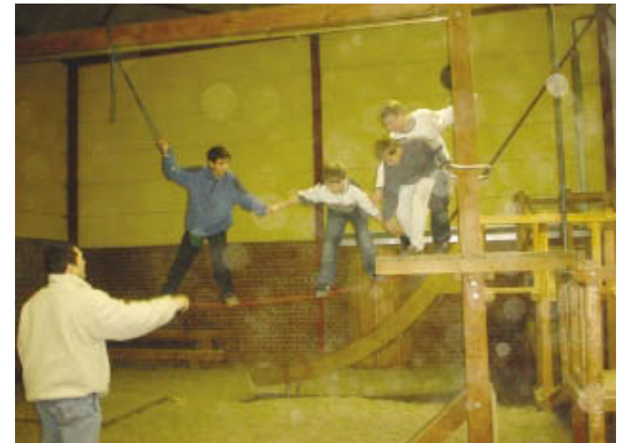
Der Kletterparcour Über Teamarbeit zum Gruppengefühl

an einer verbesserten Strukturqualität, d. h. feste Stellen für Jungenarbeiter, eine konzeptionelle Verankerung und/oder praxisbegleitende Beratungsangebote.“ (Köln 2000, S. 74)