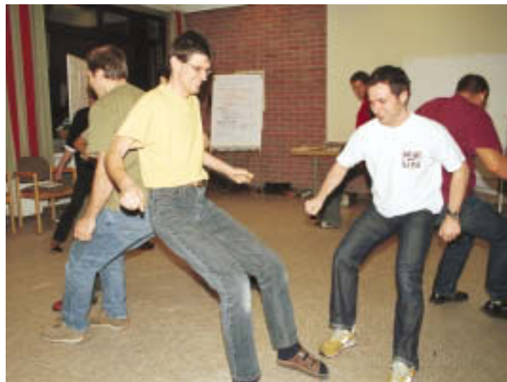
Rollenspiele und Praxisübungen während der modellhaften Ausbildung

Last, but not least sollten Formen der Kooperation innerhalb der Gruppe und mit den Fortbildnern vereinbart werden: möglichst verknüpft mit konkreten Terminabsprachen.