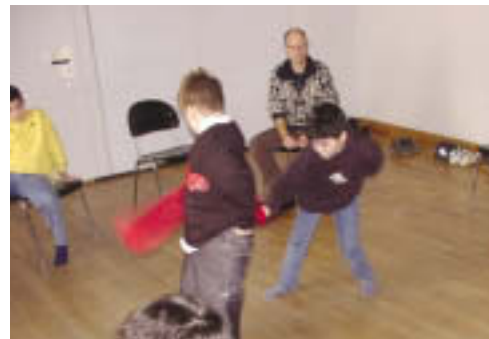
Der spielerische Kampf mit festen Regeln