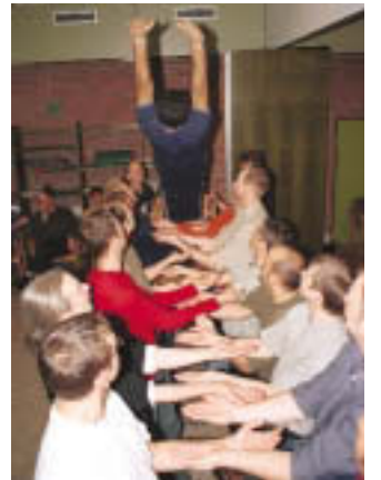
Vertrauen? Der freie Fall in die Gruppe

Besonders wichtig ist das, wenn sich das Qualifizierungsmodul über zwei Wochenenden erstreckt und die Gruppe zum zweiten Treffen zusammenkommt. Dann gilt es nicht nur, erneut miteinander in Kontakt zu kommen und die Gruppenatmosphäre wieder herzustellen; zugleich bedarf es der Moderation durch die Fortbildner, um den Bogen zum ersten Wochenende zu spannen und an dortige Arbeitsschritte und -leistungen sowie Erkenntnisse zu erinnern; und es sollte für die Teilnehmer die Möglichkeit geben, ihre zwischenzeitlichen Praxiserfahrungen einzubringen. – Anregungen für das methodische Vorgehen an dieser Stelle bieten die noch folgenden Ausführungen zum Reflexionsmodul (siehe Kapitel 4.3).