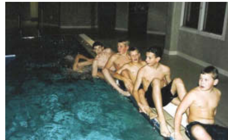
Jungs auf weiter Fahrt... ...doch wo ist der Steuermann?

Das hat zu einer quantitativen Zunahme der Kooperationen zwischen Jugendhilfe und Schule geführt; und es gibt das Bemühen von Lehrkräften und Kollegien, geschlechtsbezogenes Know-how für die eigene Arbeit zu erwerben bzw. im Schulprogramm zu verankern.